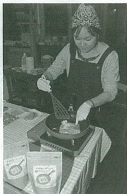
ミックス粉でガレットづくり

地元産そば粉の販売を行っている大西製粉では、そばの薄焼きで食材を包んだり、ジャムなどをつけて菓子にもなるガレット用のそ