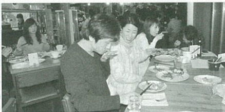
料理を楽しむ参加者

ばのミックス粉を、昨年秋から販売を開始した。同社の大西崇弘会長は「通常、ガレットを作る場合は少しねかせて作るので時間がかるが、この粉は水で溶くだけで手軽にできる」と話す。